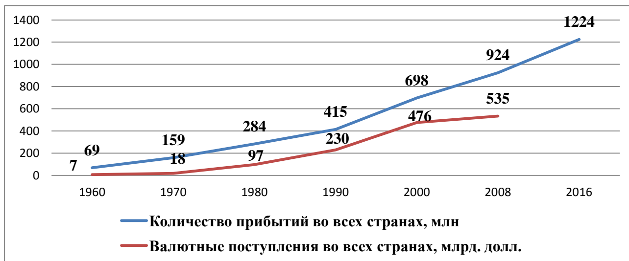
Рисунок 1 – Темпы развития международного туризма